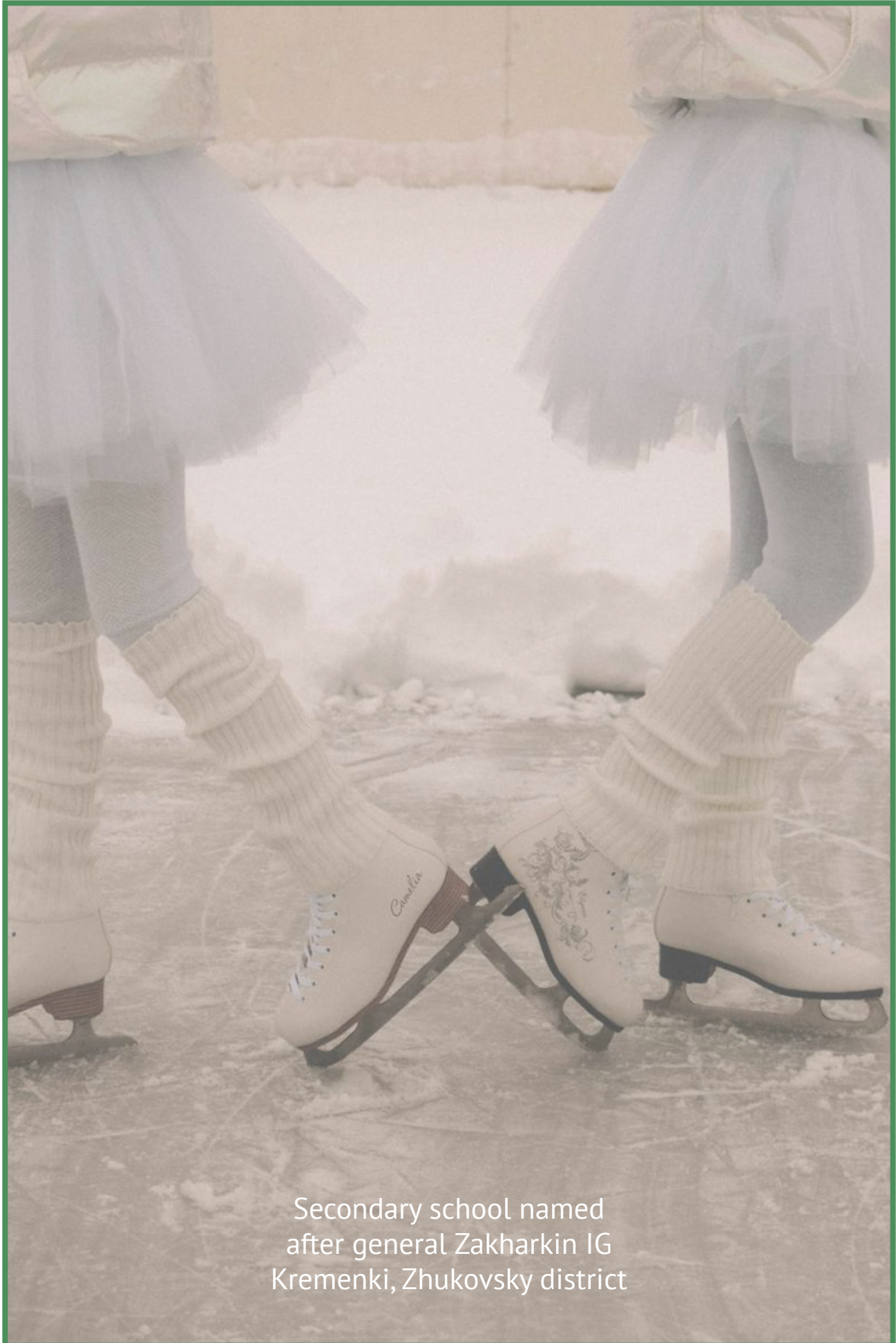
Secondary school named after general Zakharkin IG Kremenki, Zhukovsky district